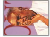
RN Govindacharya Socio-Political Activist