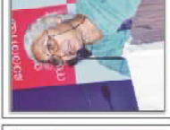
Meetha Patkar Narmada Bacho Andolan