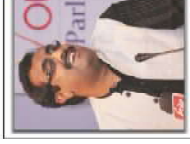
Sri Ram Madhav General Secretary-BJP