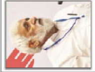
Pro. Kuldip Agnihotri VC - Central University, UP