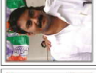
Kuldip Sharma MP-Andaman & Nicobar