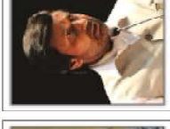
Prakash Parit Finance Minister- UP