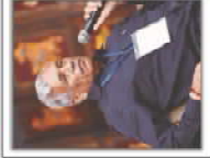
Ramnivas Goswami Speaker-Bihar Assembly