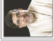
Kalish Sanyal Nobel laureate